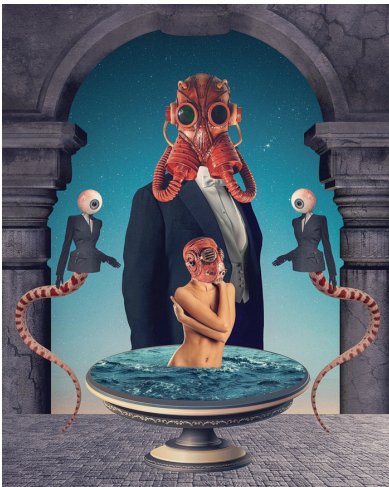
Sergey Nehaev King 1

Cette technique de création artistique ne nécessite pas de talents particuliers mais bien d'un sens artistique, d'une dose de patience, d'un peu d'inspiration et... d'une bonne paire de ciseaux !